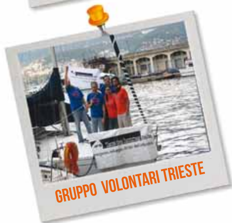
GRUPPO VOLONTARI TRIESTE