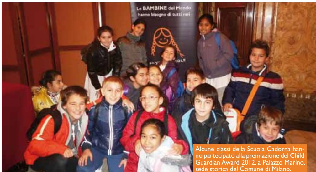
Alcune classi della Scuola Cadorna hanno partecipato alla premiazione del Child Guardian Award 2012, a Palazzo Marino, sede storica del Comune di Milano.