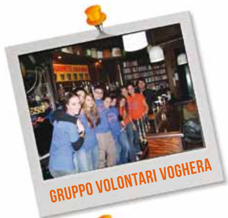
GRUPPO VOLONTARI VOGHERA

Se vuoi dedicarci un po' del tuo tempo e fare tua la missione di Terre des Hommes, diventa volontario! Puoi scegliere tra differenti modalità di collaborazione: a Milano, in sede, cerchiamo volontari per il progetto sostegno a distanza, se invece sei esperto di comunicazione, efficace nelle relazioni pubbliche e impareggiabile nella raccolta fondi, potrai diventare parte del nostro ufficio comunicazione.