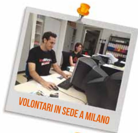
VOLONTARI IN SEDE A MILANO