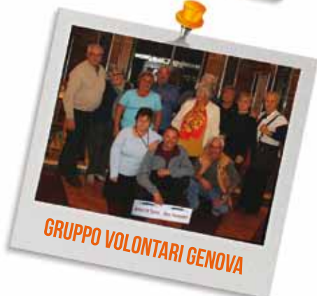
GRUPPO VOLONTARI GENOVA