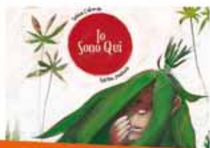
Libro Carthusia "Io sono qui" 18 euro - spedizione inclusa